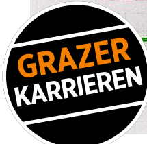
Paltauf ist ein Paradebeispiel für eine Karrierefrau – mit ihrem Know-how will sie auch andere (Frauen) ermutigen.