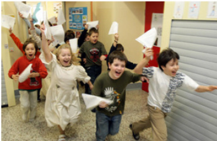
Projekte aller Art machen Spaß und fördern die Motivation der Schüler

Schulprojekte werden nicht beurteilt und hinterlassen doch bleibende Eindrücke in den Köpfen der Schüler.